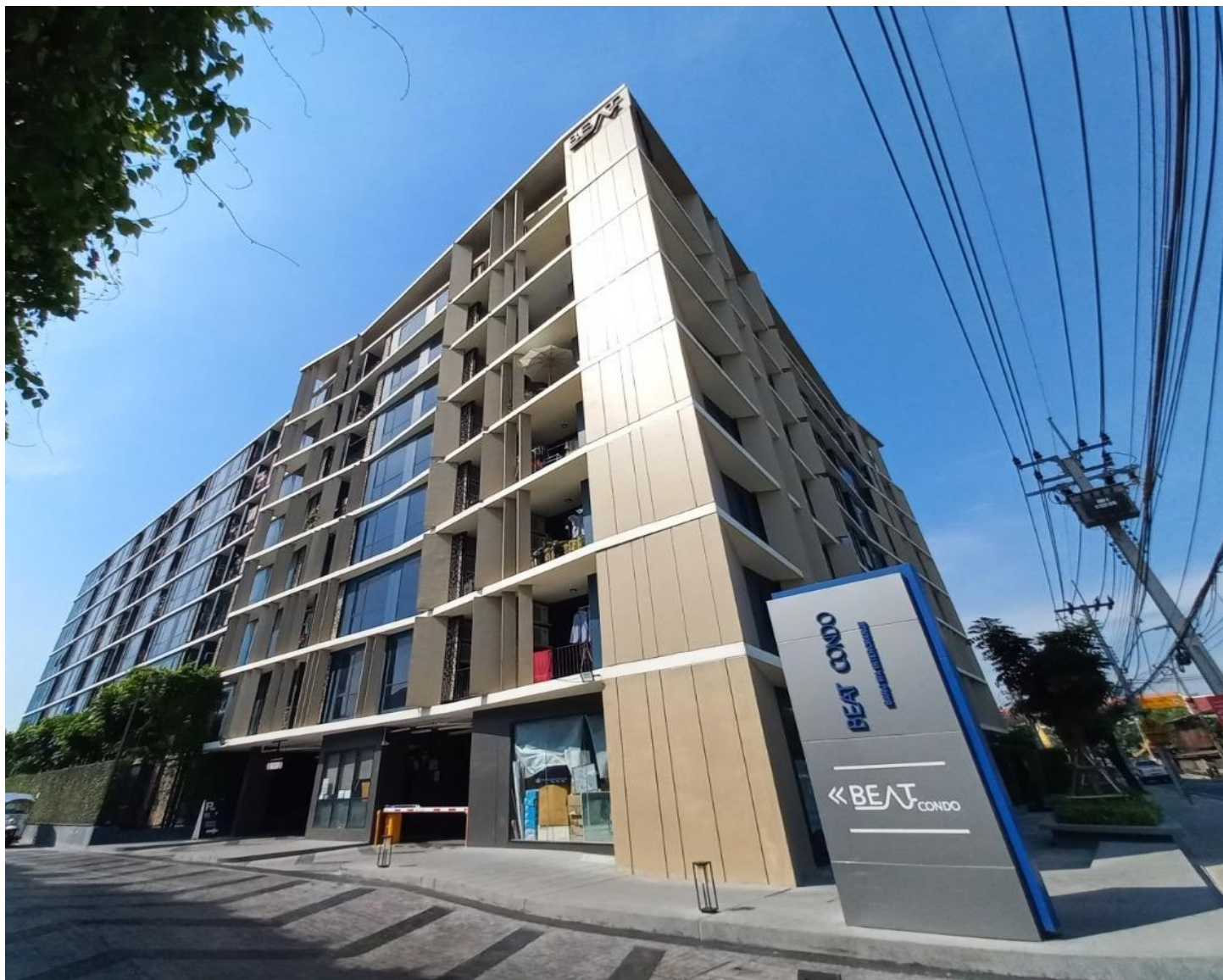
รูปที่ 1.3 สภาพโครงการในปัจจุบัน