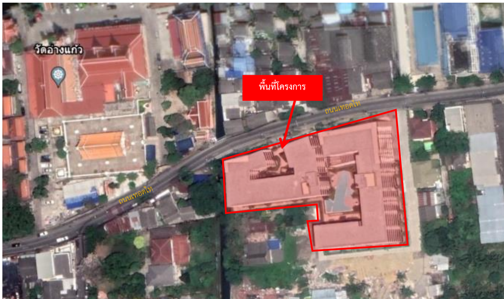
รูปที่ 1.1 พื้นที่ตั้งของโครงการ