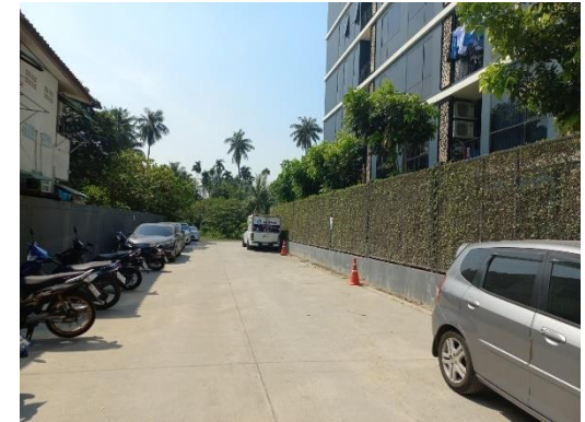
ทิศใต้ : ทางเข้า-ออก บ้านพักอาศัยด้านทิศใต้ ของโครงการในปัจจุบัน