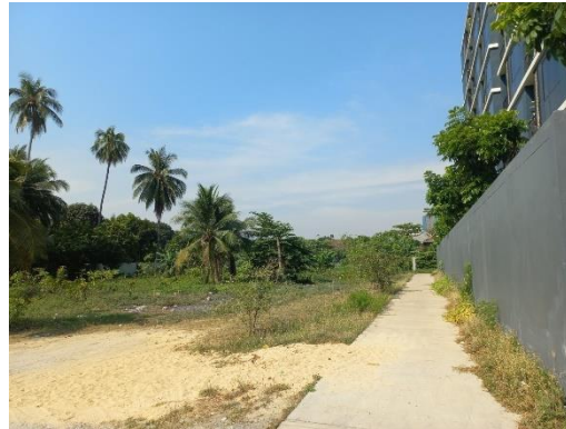
ทิศใต้ : พื้นที่ว่าง และบ้านพักอาศัย