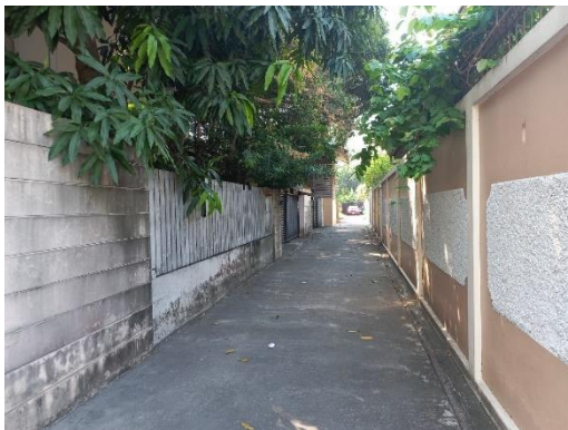
ทิศตะวันออก : พื้นที่ที่เป็นถนนส่วนบุคคล