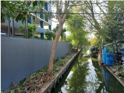
ทิศตะวันตก : คลองวัดอ่างแก้ว